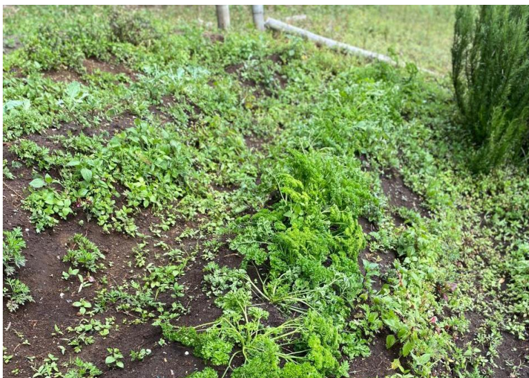
Ilustración 3 Cultivo en Marinilla

Dentro de nuestros proveedores, el insumo más importante para nuestra empresa correspondiente a las plantas, es otorgado por mujeres campesinas en situación de vulnerabilidad. Adicionalmente, el 80% de nuestros proveedores son locales, es decir, se encuentran en la ciudad de Medellín o sus alrededores y el 20% son nacionales, ubicados en otras ciudades del país. Lo anterior, con el fin de minimizar la huella de carbono y apoyar los negocios locales. Además, todos son emprendimientos o certificados en negocios verdes, cuyo valor principal es crear insumos 100% naturales y conscientes con el medio ambiente. Para nuestros proveedores emprendedores y mujeres campesinas, realizamos acompañamiento en temas relacionados a finanzas, costos, entre otros; con el fin de empoderarlos y promover en ellos habilidades para que sus negocios crezcan.