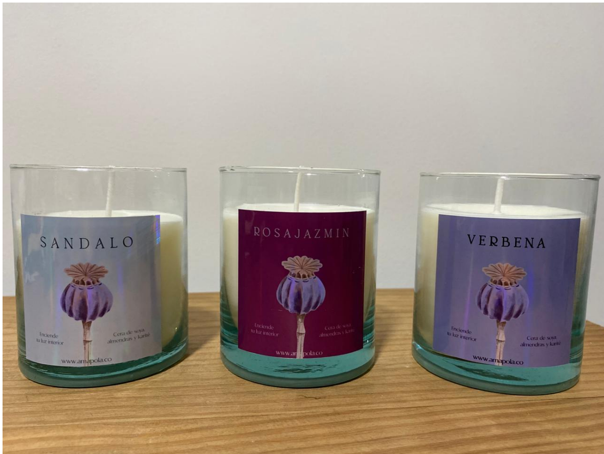
Ilustración 5 Resultado del proyecto "Enciende tu luz"