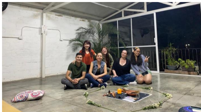
Ilustración 4 Práctica de meditación grupal

Adicionalmente, se generan incentivos para el deporte: natación, caminatas, bicicleta, yoga, entre otros; promoviendo también el bienestar físico. Para esto, en la oficina contamos con mats de yoga para llevar a cabo sesiones, adicionalmente, la ubicación de la oficina se definió de manera estratégica para que cerca estuviese un sendero ecológico, piscina, canchas y gimnasio, con el fin de facilitar el acceso al deporte incluso durante las jornadas laborales.