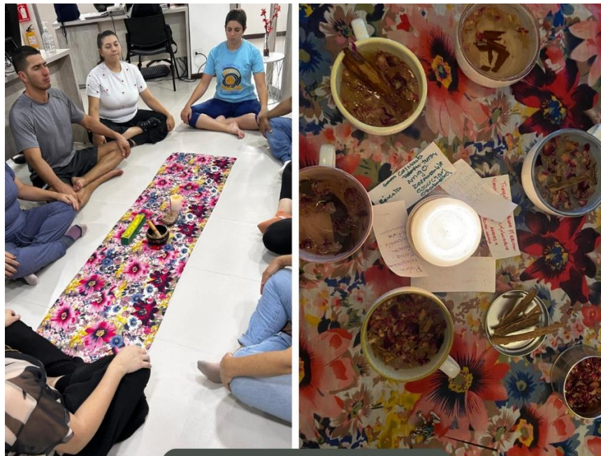
Sesiones de meditación y formación

PROVEEDORES: Les pagamos un precio superior al del mercado, les brindamos asesorías en escalamiento y estructuración económica, mecanismos de financiación a través de proyectos. Realizamos encuentros donde hacemos círculos de palabra orientados al ser y sesiones de meditación guiada.