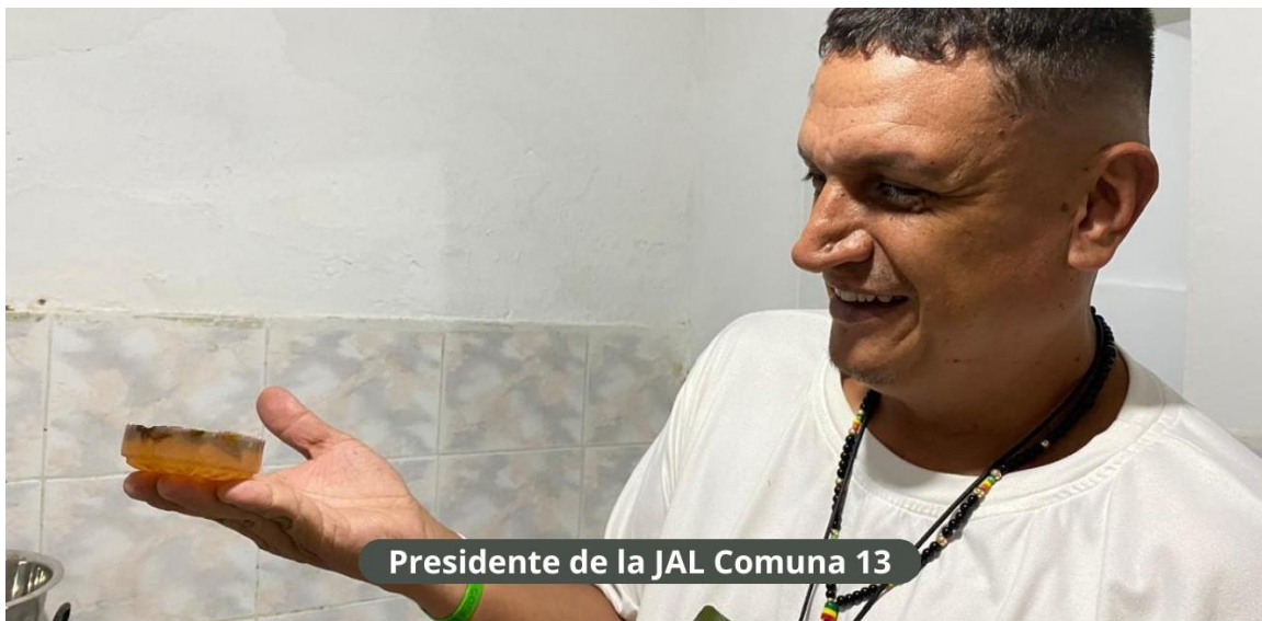
Presidente de la JAL Comuna 13