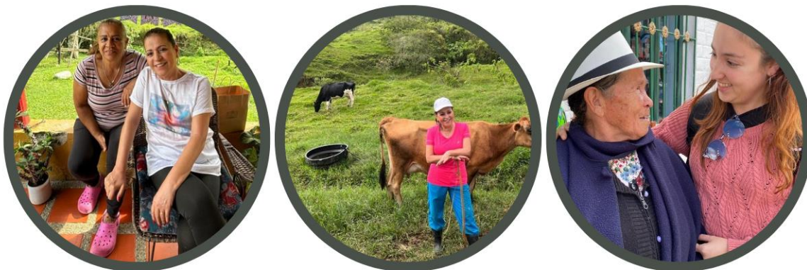
Ilustración 1 Mujeres que hacen parte de nuestra empresa y son pilares de nuestro propósito empresarial.

Nuestros principales proveedores son mujeres campesinas, con quienes trabajamos estrechamente para brindarles herramientas que les permitan desarrollar nuevas habilidades personales y profesionales. Además, pagamos un precio superior al del mercado, promoviendo la dignificación de las prácticas ancestrales, el valor del campo colombiano y la labor del campesino/a.