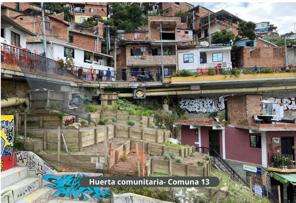
Huerta comunitaria- Comuna 13