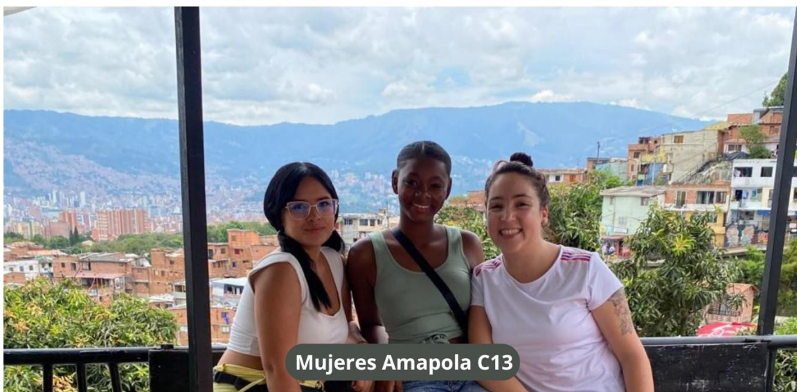
Mujeres Amapola C13