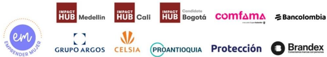
Ilustración 2 Aliados Convocatoria Emprender Mujer

Certificaciones y Reconocimientos: Ganadores de la convocatoria Fondo Emprender en 2022. Fuimos seleccionados para participar en el Foro Mundial She Is 2023, en la muestra comercial de empresas lideradas por mujeres. Adicionalmente, fuimos seleccionadas en la convocatoria Emprender Mujer, convocatoria liderada por Impact Hub, grupo Argos, Bancolombia, Comfama, Protección, Celsia, Proantioquia y Brandex.