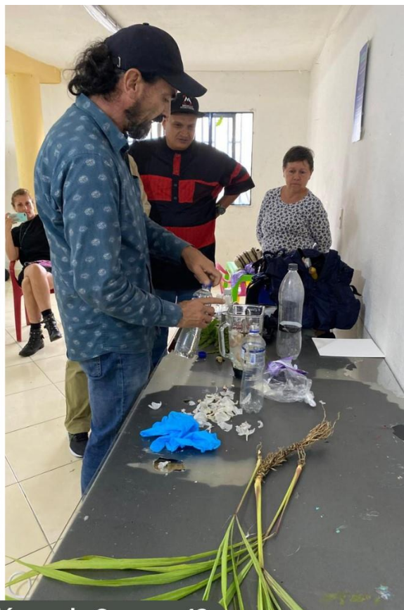
Procesos de formación en la Comuna 13