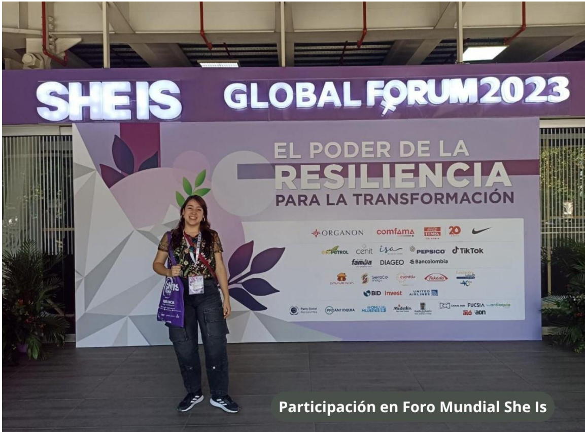
Participación en Foro Mundial She Is