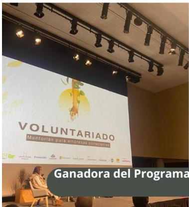
Ganadora del Programa Emprender Mujer y la convocatoria Voluntariado para Empresas Conscientes